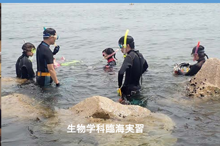
生物学科臨海実習