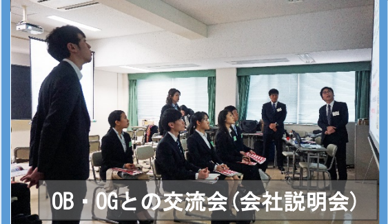
OB・OGとの交流会(会社説明会)