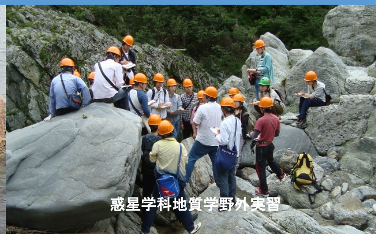
惑星学科地質学野外実習