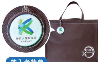
納入者特典 オリジナルキーホルダー