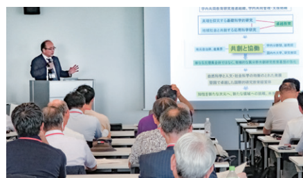
神戸大学人の集い 藤澤学長講演

毎年10月末に開催される「ホームカミングデー」や卒業生と神戸大学執行部との懇親の場である「神戸大学人の集い」を神戸大学と共催しています。